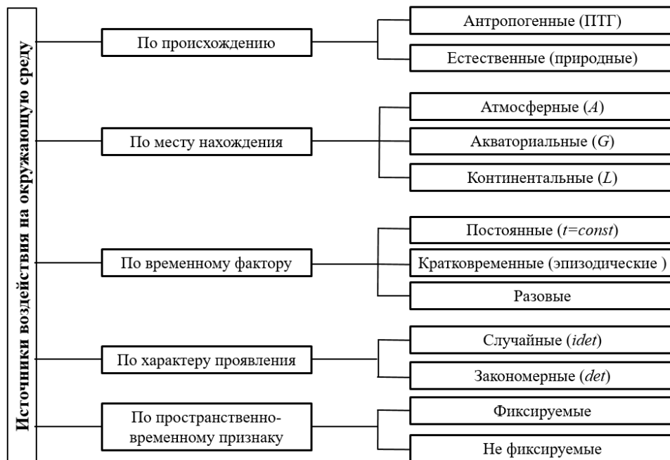
Рис. 1. Классификация источников негативного влияния на окружающую среду

Одним из основных аспектов всестороннего инженерно-экологического анализа реальной антропогенной обстановки в конкретной ПТГ является глубокое исследование всех возможных источников вредных воздействий на компоненты биогеоценоза.